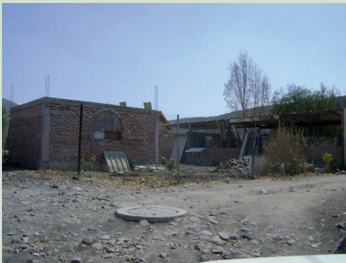
EL PREDIO ACTUALMENTE SE ENCUENTRA EN SU ESTADO NATURAL COMO SE MUESTRA Y SE ENCUENTRA DELIMITADO CON UNA CERCA DE PIEDRA.