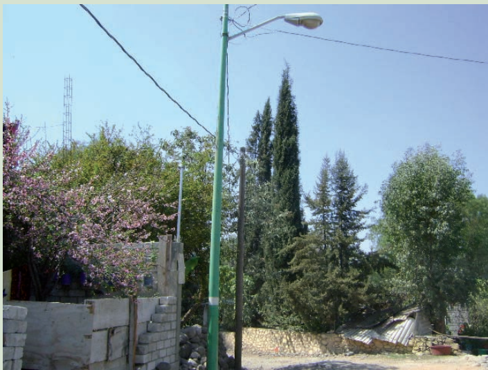
EL PREDIO DE REFERENCIA CUENTA CON LOS SERVICIOS DE DRENAJE, AGUA POTABLE Y ALUMBRADO PUBLICO A UNA DISTANCIA APROXIMADA DE 80 MTS.