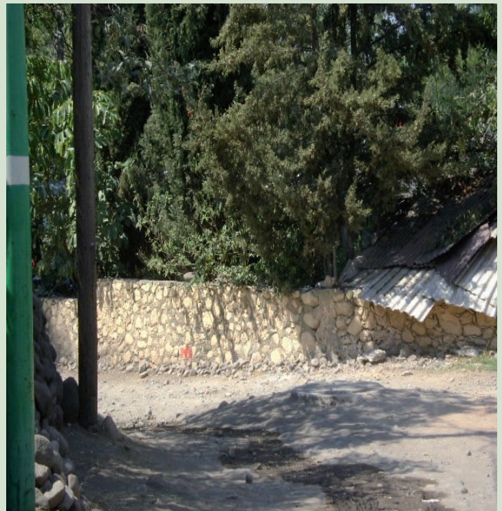
LA CALLE DE ACCESO DEL PREDIO NO ESTA URBANIZADA.

3.- Asimismo se procedió a realizar una visita física al predio de referencia por lo que se anexa el reporte fotográfico: