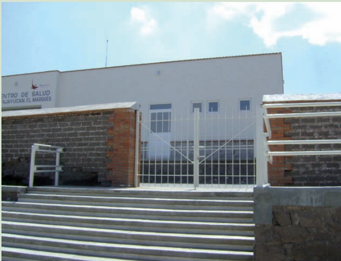
EL CENTRO DE SALUD CUENTA CON TODOS LOS SERVICIOS BASICOS